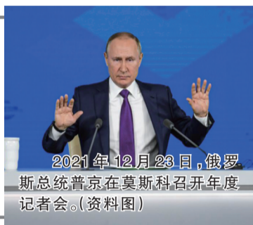
2021年12月23日，俄罗斯总统普京在莫斯科召开年度记者会。(资料图)

俄总统弗拉基米尔·普京回应说，假如西方国家对俄天然气采取限价措施，俄方可能会切断对其所有能源供应。