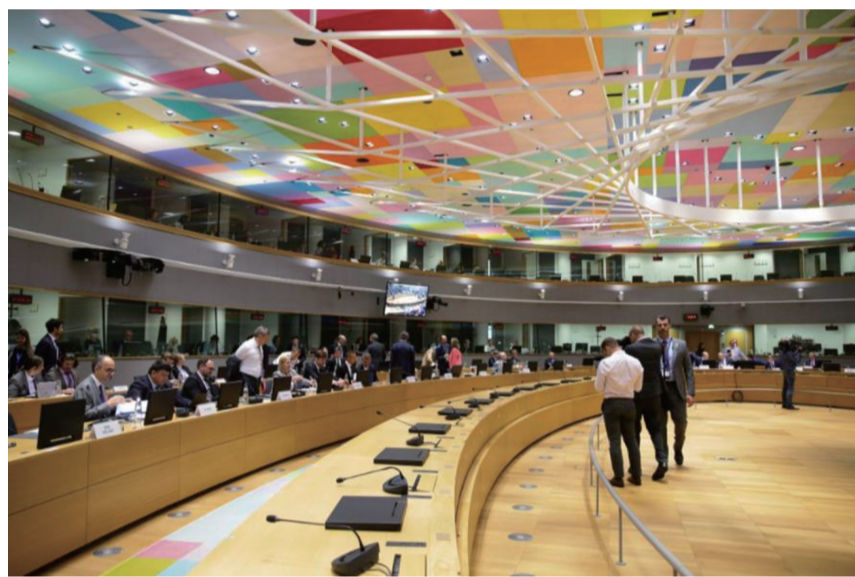
▲ 7月26日，欧盟能源部长特别会议在比利时布鲁塞尔举行。这是会议现场。(资料图)