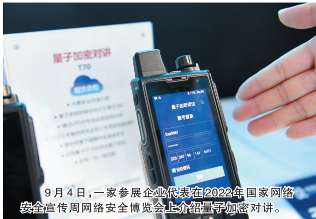
9月4日,一家参展企业代表在2022年国家网络安全宣传周网络安全博览会上介绍量子加密对讲。