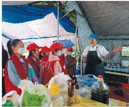
工作人员详细介绍月饼的制作流程

通过这次小记者活动,我明白了看似简简单单的月饼,它的制作过程却并非那么容易,原来小小的月饼藏着这么多的奥秘。