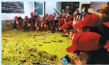
小记者通过沙盘了解大同长城概况

整个参观的过程让我感触最深的是老师介绍的天镇县李二口长城。我的老家就在天镇县,那里我也去了很多次,每次都是走马观花,并不了解其中的历史。听了老师的讲解,让我对长城有了更深入的认识,希望今后以自己的实际行动来保护长城,同时,呼吁身边的人也加入到保护长城的行列中来。