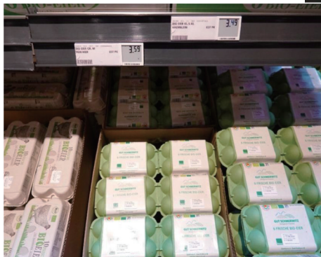
▲ 这是9月6日在德国柏林一家超市拍摄的鸡蛋价格。(资料图)

受能源和原材料价格飙升影响，德国的面包店想出各种办法艰难维持生计，但经营者依然担心，如果大环境没有改变，这一行业将面临生存危机。