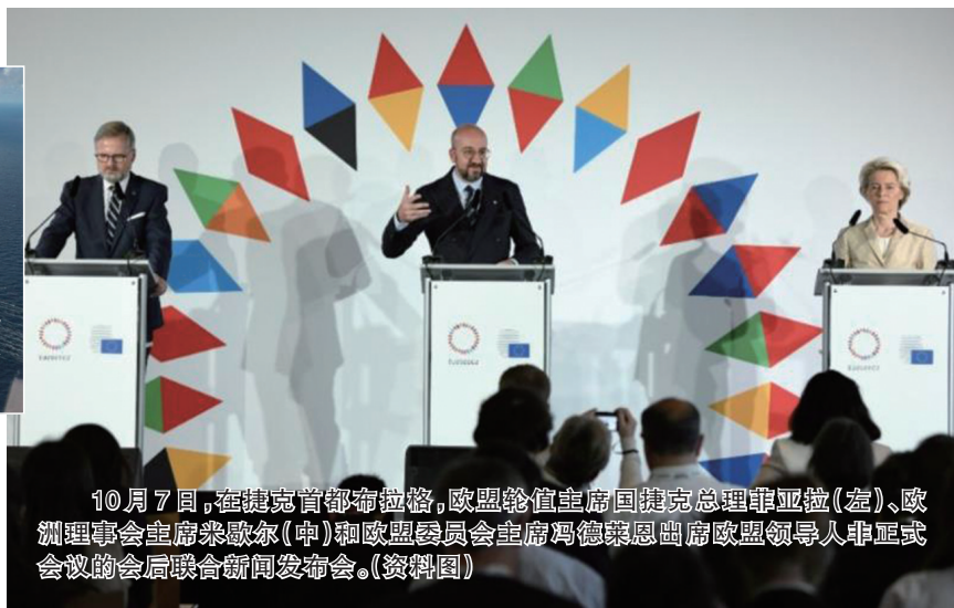
10月7日，在捷克首都布拉格，欧盟轮值主席国捷克总理菲亚拉(左)、欧洲理事会主席米歇尔(中)和欧盟委员会主席冯德莱恩出席欧盟领导人非正式会议的会后联合新闻发布会。(资料图)