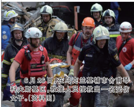
6月26日，在乌克兰基辅市舍甫琴科夫斯基区，救援人员搜救出一名受伤女子。(资料图)

乌克兰首都基辅市市长克利奇科10日在社交媒体发文说，当天早上基辅市中心舍甫琴科夫斯基区发生多次爆炸，有关机构人员已赶往现场。据乌克兰各地军事部门消息，当天上午，波尔塔瓦州、利沃夫州、捷尔诺波尔州、日托米尔州等地也发生爆炸。