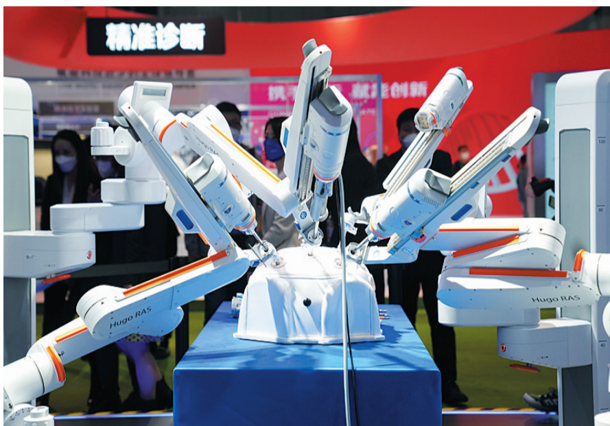
11月6日在第五届进博会医疗器械及医药保健展区美敦力展台拍摄的手术机器人。

进博会是“世界的市场”“共享的市场”“大家的市场”,中国市场是全球客商向往的地方。正如一家花卉展商在一张推荐卡片上写下的话:来到这里,“好事发生”!