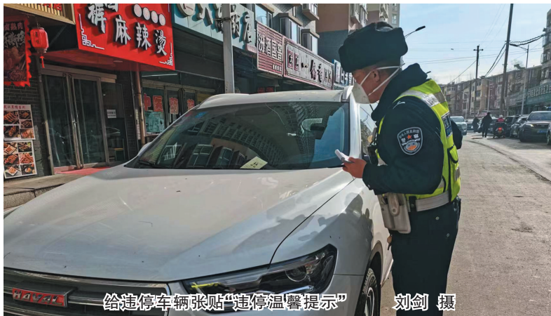
给违停车辆张贴“违停温馨提示”

对此，该大队民警表示，给群众出行安全护航，助力企业复工复产，张贴温馨提示单而不是开罚单，希望通过这种方式，提高车主们的自觉意识，主动遵守交通法规，杜绝违停现象。