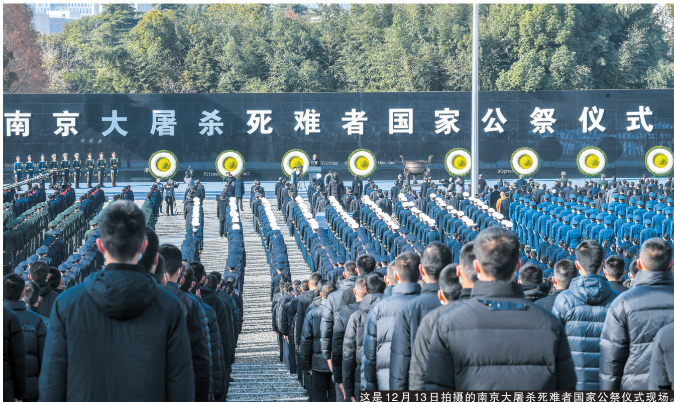
这是12月13日拍摄的南京大屠杀死难者国家公祭仪式现场。

13日，南京在寒冬中迎来第九个国家公祭日。10时01分，凄厉的防空警报响起，江上的轮船、路上的汽车跟随鸣笛，警报声、鸣笛声响彻大街小巷、长江两岸。