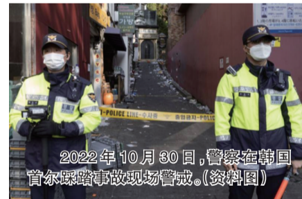
2022年10月30日，警察在韩国首尔踩踏事故现场警戒。(资料图)

韩国警方23日说，计划本周末圣诞节期间向全国热门旅游景点派遣超过650名警察，以防范发生踩踏悲剧。