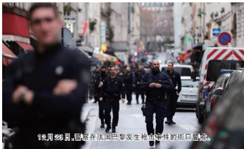
12月23日，警察在法国巴黎发生枪击事件的街口警戒。

巴黎检察官洛蕾·贝库奥说，袭击者有案底，曾被临时拘禁，本月12日刚获释，仍受到司法监控。她还说，枪击是否