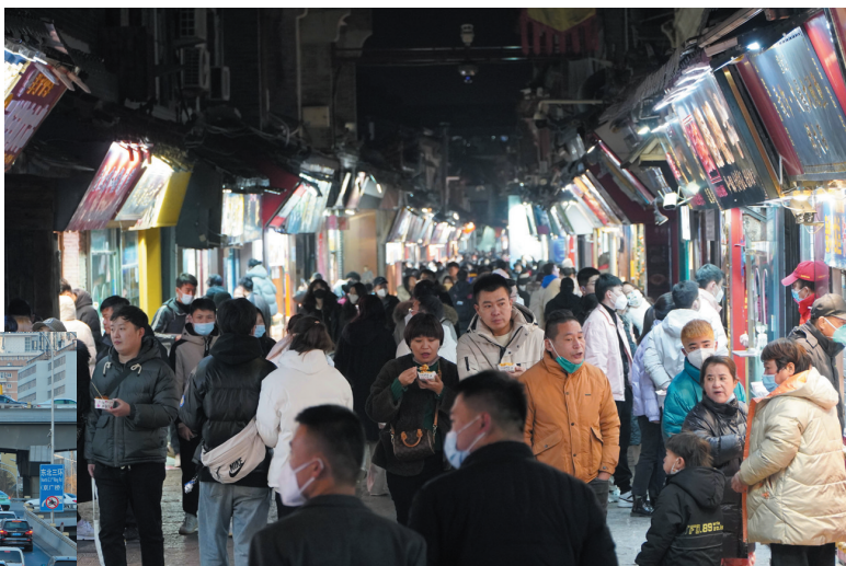
▲1月2日晚,人们在济南市芙蓉街游览、品尝小吃。