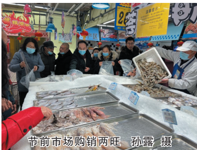
节前市场购销两旺 孙露 摄

本报讯(记者 孙露)置办年货、购买新衣、选购礼品……记者昨日走访市场了解到,春节临近,我市各大商圈线下接触性消费复苏迹象明显,一场场