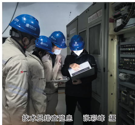
技术员排查隐患

本报讯(记者 张彩峰) 新春之际,正值保供的关键时期,在山西大唐国际云冈热电有限责任公司生产现场,工作人员忙碌的身影随处可见。为保证春节期间电力、热力稳定供给,该公司认真部署安排,提前进入节日保供备战状态,确保市民温暖、祥和过年。