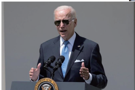
▲ 2022年7月27日，美国总统拜登在华盛顿白宫出席活动。(资料图)

美国白宫法律顾问和特勤局16日分别回应国会共和党人提出的要求，称民主党籍总统拜登位于特拉华州威尔明顿市的私宅不留存访客记录。