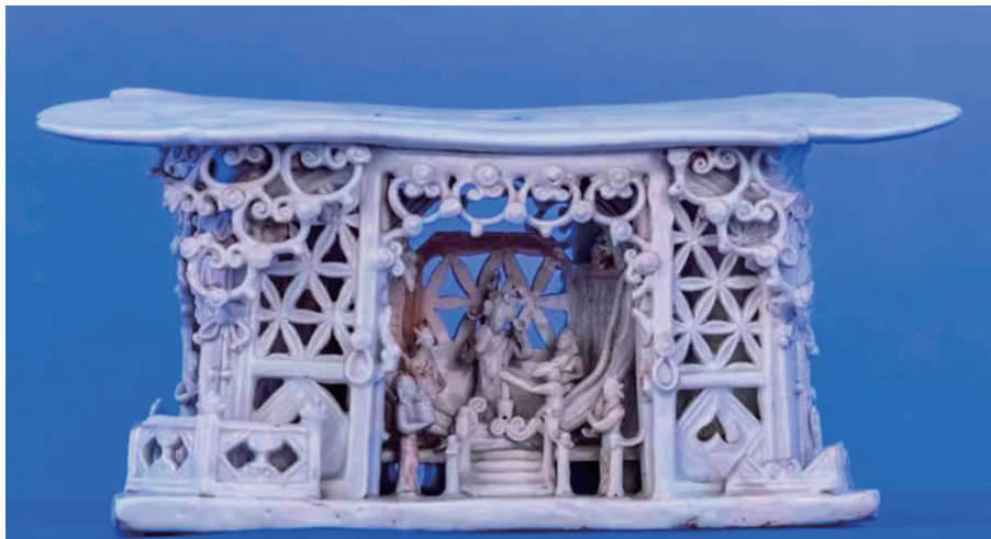
捣药玉兔 藏身影青釉瓷枕

兔子机智敏捷、善良温顺，它能引起人们奇妙的联想，所以生肖兔具有善、美、祥和的寓意，人们在它身上寄托了美好的愿望。自古以来，兔子作为瑞兽就被雕刻在器物上、绘入画作中，随着时光流逝成为珍贵的历史见证。在大同市博物馆里，有一件价值连城的“兔子”——元代广寒宫影青釉瓷枕。