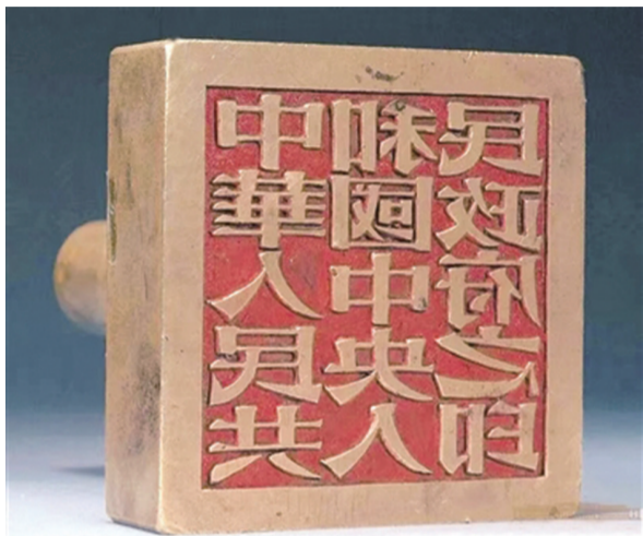
中华人民共和国 中央人民政府之印