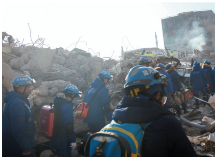
2月10日，中国蓝天救援队队员在土耳其马拉蒂亚省参与搜救。

然而，救援仍面临巨大困难。两国仍有数以万计灾民无家可归，亟待食物等基本物资援助。