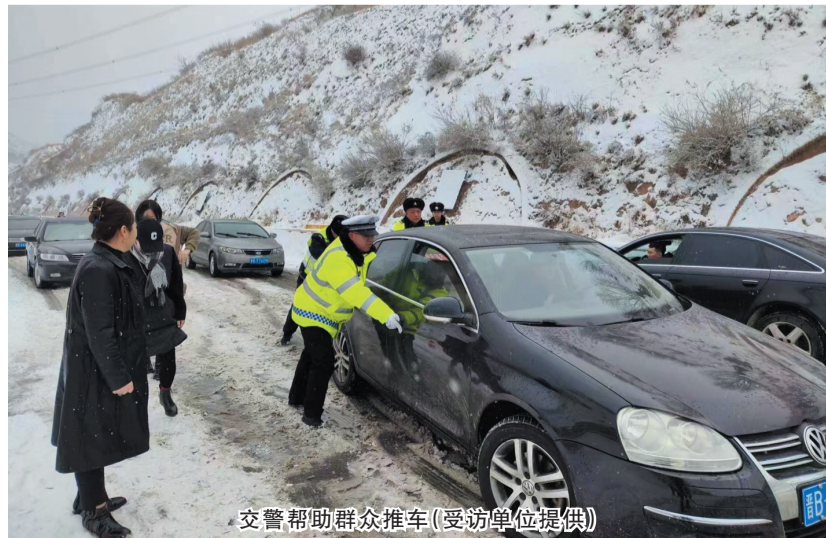
交警帮助群众推车

雪中受困的群众纷纷向执勤民警求助,民警秒变“引路人”“推车侠”“修理工”……帮助群众脱困。宣传民警还利用微博、微信、抖音等新媒体平台,及时发布路况信息和冰雪道路出行提示信息。