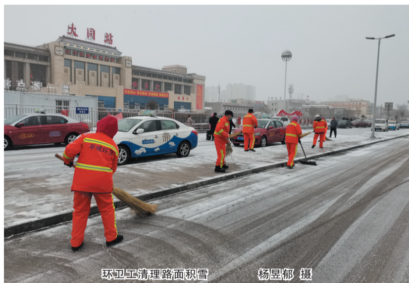
环卫工清理路面积雪

为了妥善做好清雪工作,环卫部门采取人机联动的作业模式,对主次干道、人行便道、广场、岗区、公交站点等区域的路面积雪全方位、不间断清理,最大限度保障道路畅通和出行安全。