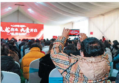
开盘热销 人气爆棚

全龄化康养住区——上水湾·龙园将于今年交付,届时这张大同乃至山西最闪亮的康养名片将再次提升大同地产的美誉度和城市影响力。