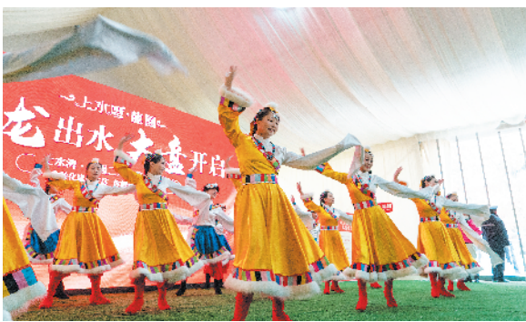
载歌载舞 热闹非凡