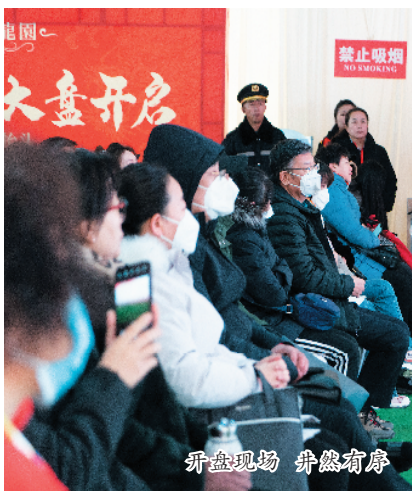
开盘现场 井然有序

在全省全力打造“康养山西、夏养山西”品牌、建设康养旅游城市、康养小镇、康养产业园、康养度假区,搭建全省域、大康养的产业格局之际,大同翔龙地产十年磨一剑,经过多次对北京、上海、广州、乌镇及台湾地区、美国、日本等国内外高端康养项目的考察调研,翔龙地产强力打造国内一流的全龄化康养住区,首创以居、养、医、护、康、乐、学全配套来成就健康养生新居住理念,打出“你想要的我全给!”品牌口号。