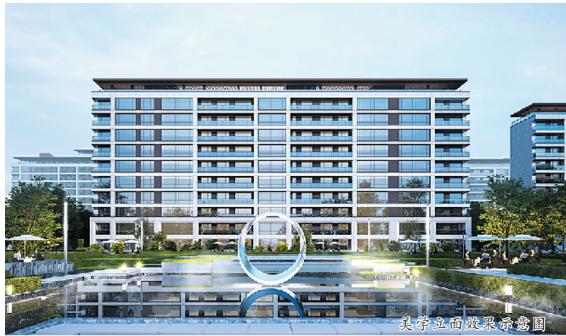
美学立面效果示意图

园林景观打造了6.8万平方米的东方官派山水园境，规划一河两轴、五园九景。中轴以水为脉南北贯通，犹如一只瑞狮象征着品位与智慧；东西两条超级景观绿轴，筑起家门口的静音空间和生态屏障：“四水归堂”下沉会所，地上回形连廊，营造如同