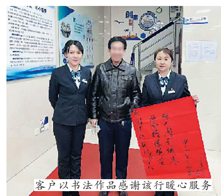
客户以书法作品感谢该行暖心服务

本报讯 近日,建行魏都大道支行收到了一位老年客户书写的书法作品,感谢该支行为其提供的暖心服务。