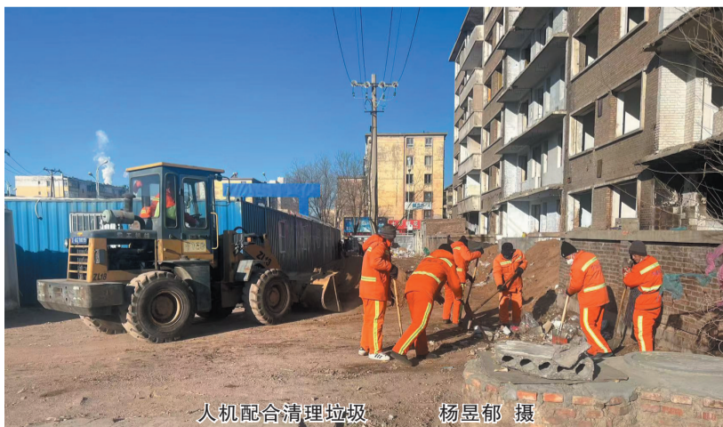
人机配合清理垃圾

本报讯(记者 杨昱郁)“以前这里堆的全是垃圾,刮风的时候塑料袋、泡沫塑料、灰尘满天飞,现在全部清理