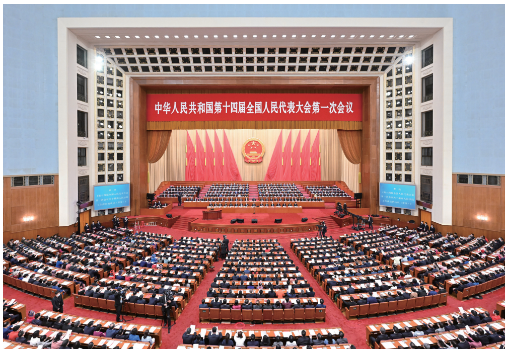
3月13日,第十四届全国人民代表大会第一次会议在北京人民大会堂举行闭幕会。

新华社北京3月13日电 中华人民共和国第十四届全国人民代表大会第一次会议,在圆满完成各项议程,产生新一届国家机构组成人员后,13日上午在北京人民大会堂闭幕。