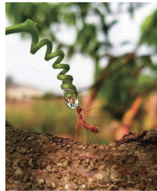
给口水喝吧，一滴就好。