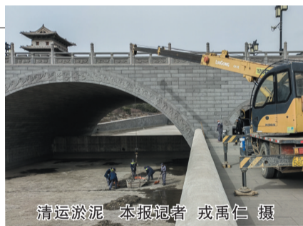
清运淤泥

工作已进入尾声。下一步,他们会随时关注天气变化,对护城河进行注水,开展水生植物补植作业。