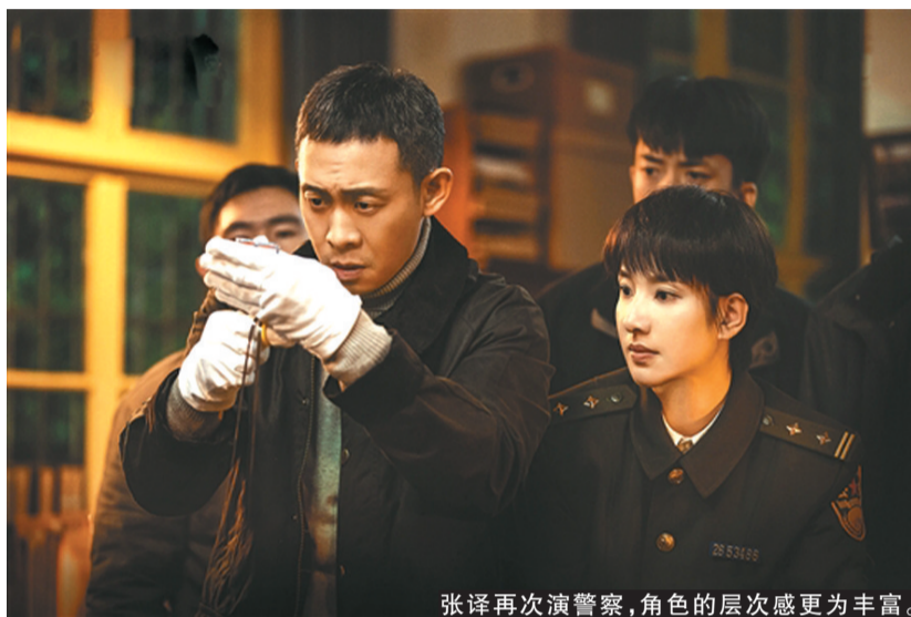
张译再次演警察,角色的层次感更为丰富。

《狂飙》之后哪部剧最火?同样由张译主演的刑侦剧《他是谁》开播以来,优酷站内热度连续7天破万;央视首周收视1.57%,位居第一。该剧对视频平台的拉动作用非常明显,刷新了2019年以来优酷用户拉新、会员收入等多项纪录,优酷在苹果商店的下载量也升至视频类App之首。从《狂飙》到《他是谁》,为何带有现实主义色彩的犯罪题材剧如此火爆?最近,《他是谁》主创团队在接受媒体采访时透露不少创作细节,从中或许能总结出一些经验。