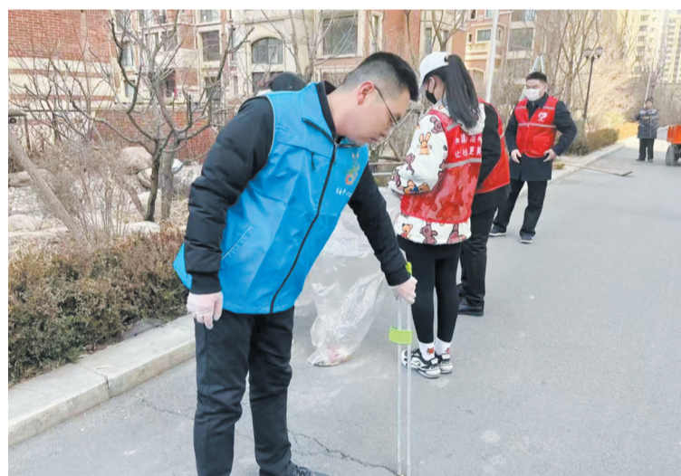
▲近日,平城区文兴社区组织社区党群服务中心、新时代文明实践站志愿者,在辖区绿化带捡拾垃圾,优化社区环境,倡导文明新风。

新旺街道和信社区在宣传中普及节水理念,与居民互动分享节约用水妙招,倡导大家共同树立节水观念,养成节水习惯。和信社区还设置了相关奖励机制来鼓励居民用实际行动节约每一滴水,共同营造珍惜水、节约水、保护水、关心水的良好氛围。