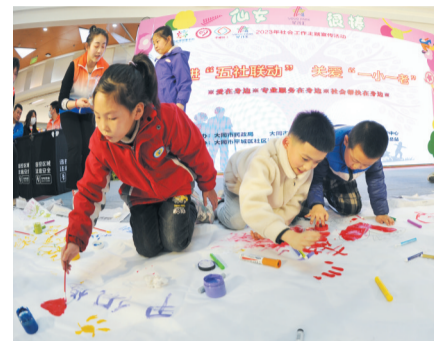
孩子们在社工的指导下用心创作

会工作及社工站的影响力。25日下午,在星茂汇购物中心开展的社工周系列宣传活动现场,进一步宣传了社会工作的专业作用,展示社会工作发展成果。各街道社工站、社会组织的社工、志愿者及居民表演了舞蹈、钢琴演奏、双簧等文艺节目,展现出“一老一小”积极向上的精神风貌。同时,还邀请专业心理咨询团队与小朋友们进行了游戏互动。此外,清远街道大齿社区、新旺街道工农路社区、迎宾街道绿园社区等也在辖区内宣传社会工作的知识,鼓励居民在日常生活中多做好事,弘扬社会工作精神,传播社会工作知识。