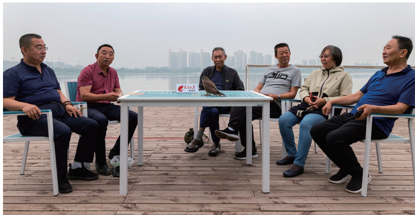
《发现大同·飞鸟翔集》第100期特约摄影师专题访谈