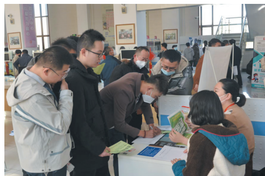
求职者登记个人信息