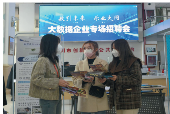
用工单位工作人员向求职者介绍求职信息