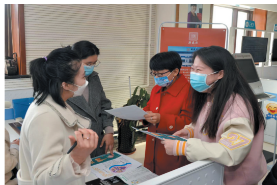
求职者咨询岗位信息、待遇等问题