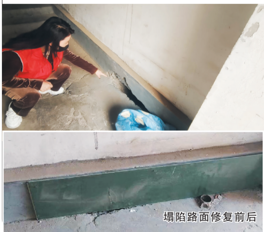
塌陷路面修复前后

4月11日,永泰街道柳航里社区工作人员、网格员在巡查社区时发现,一号楼五单元的进门楼道地面塌陷,出现一个大洞,约1米多长、30厘米宽、3米多深。由于大洞底下是污水管道通过的地方,洞口还时常发出阵阵恶臭。居民害怕踩空,每次进出楼门都得小心绕行。社区随即协调物业,联系维修工人对此处破损进行修复,保证了居民的出行安全和便利。社区、物业快速联动,把群众的事放在心上,办实事,得到了居民的纷纷点赞。