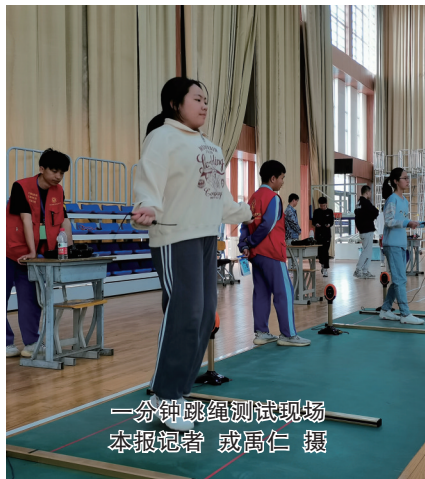
一分钟跳绳测试现场

二，考生从立定跳远、一分钟跳绳、掷实心球、握力/体重、坐位体前屈、一分钟坐姿屈膝仰卧起坐（女）、一分钟正手位俯卧撑（男）六个项目中选取两个项目作为考试项目，各15分。