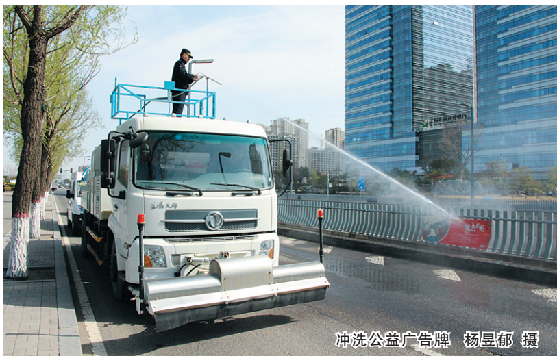
冲洗公益广告牌

本报讯（记者 杨昱郁）为迎接即将到来的“五一”假期，26日，平城区城市管理局环境治理监督大队开展了公益广告牌清洗行动。