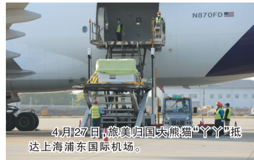
4月27日,旅美归国大熊猫“丫丫”抵达上海浦东国际机场。

据了解,中美开展大熊猫合作研究二十年来,在饲养管理、疾病防控、人员培训、公众教育、人文交流等多方面取得良好成效,为促进濒危物种保护研究和增进中美人民友谊发挥了积极作用。