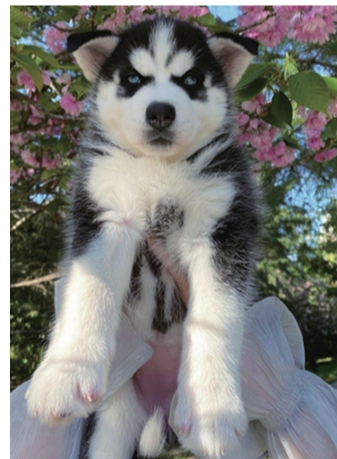
快放我下来，我超凶。