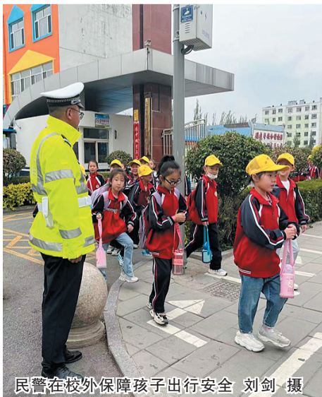
民警在校外保障孩子出行安全

同时,民警还向接送学生的家长讲解接送孩子途中应该注意的安全事项,劝导家长以身作则,教育孩子从小养成遵守交通安全的好习惯,增强学生们的交通安全意识和自我保护能力。