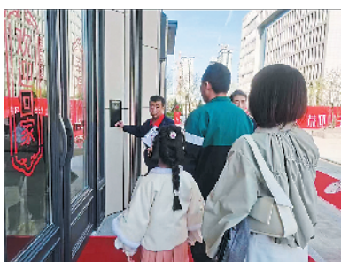
盛境已成 幸福归家

2022年,地产行业担负着巨大的压力,一边是工地延迟施工、材料成本增加,延期交付几乎成为常态;一边是客户对房屋品质的要求升级,让房企面临着较以往更大的交付压力。但在此巨大压力之下,天香蓝郡克服重重困难,在冬季停工期尚未结束时便积极组织开工,于今年5月1日盛大交付。