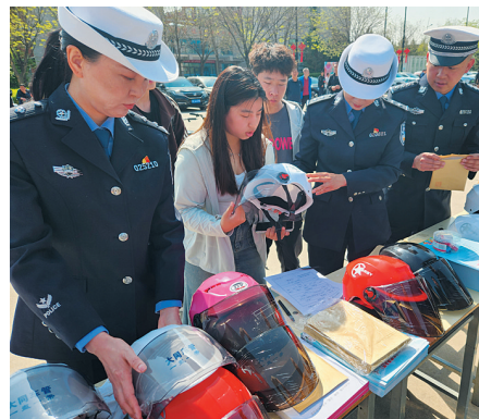
民警向大学生赠送头盔

活动中，公安交警来到校园，向广大教职员和在校大学生发出“一盔一带”安全守护倡议，并为教职员和大学生代表赠送了头盔。车管民警现场为符合电动车登记上牌条件的大学生办理了电动车登记手续，宣传民警为教职员和大学生发放了宣传资料，现场解答了师生有关交通安全方面的问题。