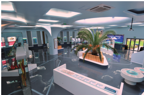
“富乔”环保教育展厅

今年我市又选取平城区新水湾·龙园作为垃圾分类重点示范小区,科技赋能让生活垃圾分类更“智慧”。