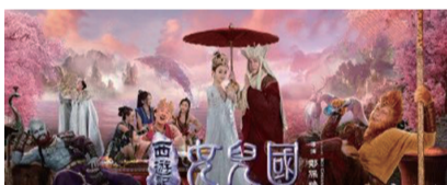
中央电视台(六套)19:58播出