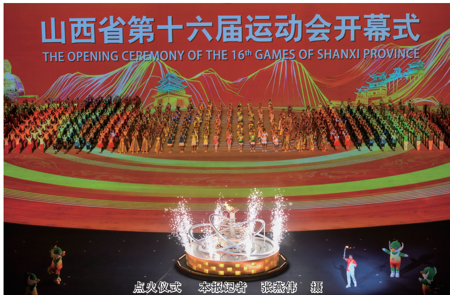
点火仪式

全国青运会10米气手枪个人冠军，德国青年世界杯赛、埃及世界锦标赛10米气手枪团体冠军，2022年被国家体育总局评