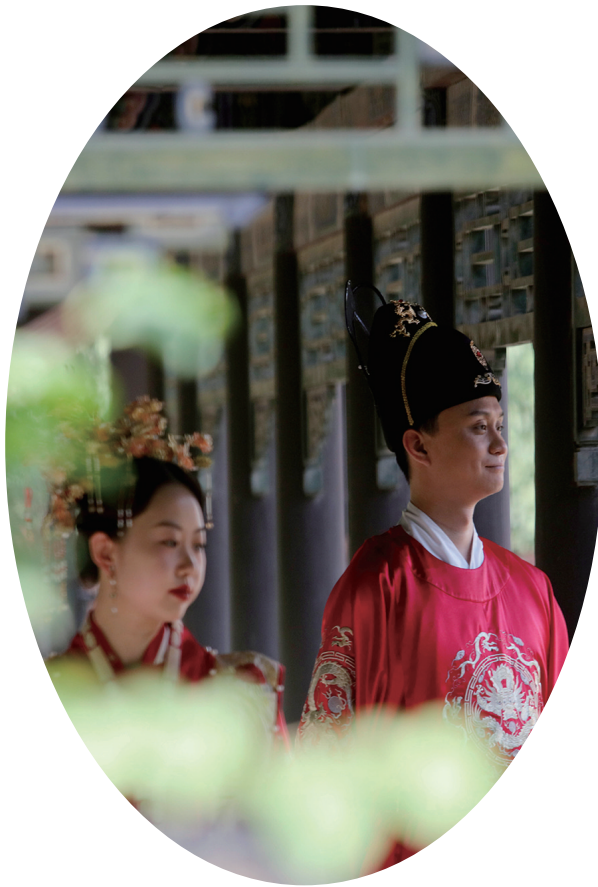
善化寺独特的古建筑吸引年轻人拍照留念