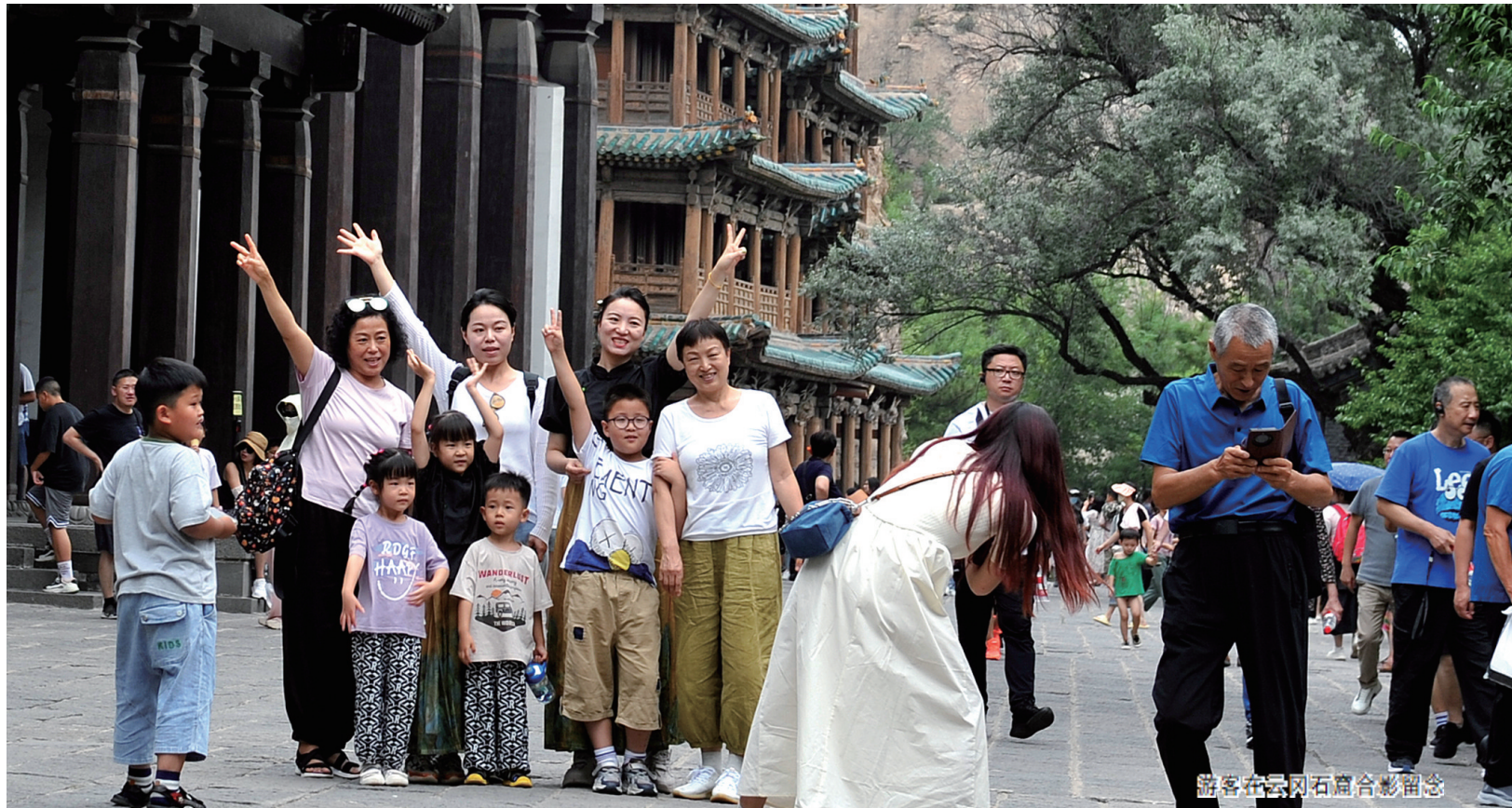
游客在云冈石窟合影留念