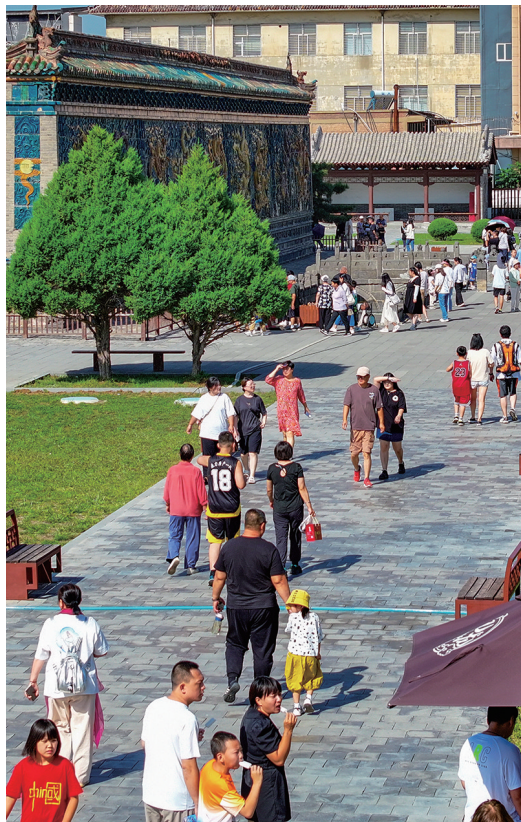
九龙壁前游客众多