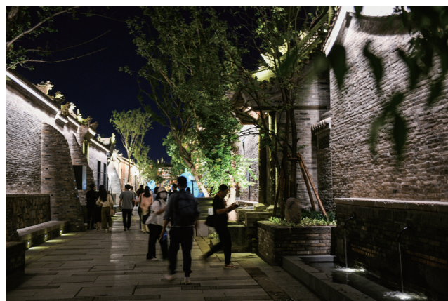
漫步在历史文化街区