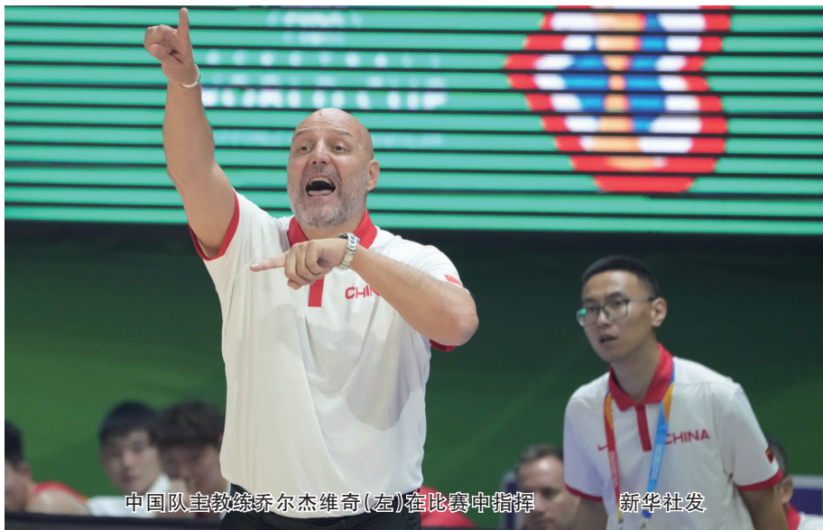
中国队主教练乔尔杰维奇(左)在比赛中指挥