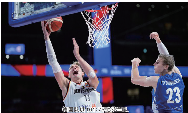
德国队以101:75胜芬兰队

在29日进行的2023年篮球世界杯小组赛第三轮比赛中，多米尼加、澳大利亚和意大利队锁定16强席位，东道主菲律宾队和日本队则双双落入17-32名的排位赛。