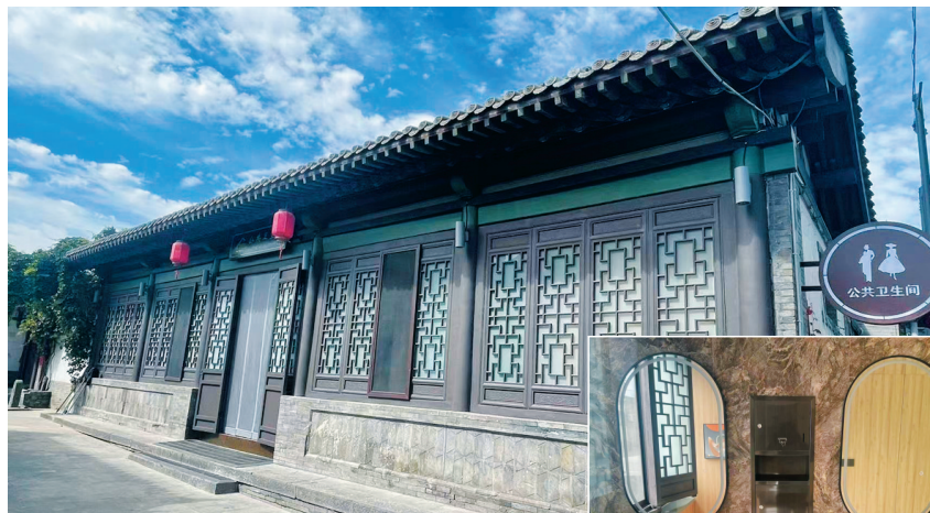
▲ 古色古香的公共卫生间 ▶ 升级改造后的洗手池