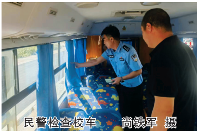
民警检查校车

本报讯（记者 尚铁军）为确保校园周边道路交通安全畅通，8月30日，市公安局交警支队六大队对校车进行全面“体检”，排查安全隐患，强化校园周边道路管控，同时，重点对