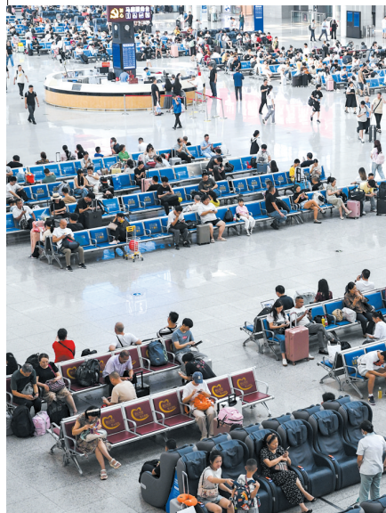
▲ 8月31日,旅客在重庆火车站候车室候车。

标准明确了非遗数字资源采集和著录的总体要求,规定了民间文学、传统音乐、传统舞蹈等十大门类非遗代表性项目数字资源采集方案编制、采集实施、资源著录方面的业务要求和技术要求,共11部分。