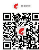
长按识别二维码进入店铺

农夫山泉饮用天然水12L装售价 22 元/桶,买4桶赠送朴云思泉矿泉水1件(12瓶)数量有限赠完为止。平城区内免费送水上门