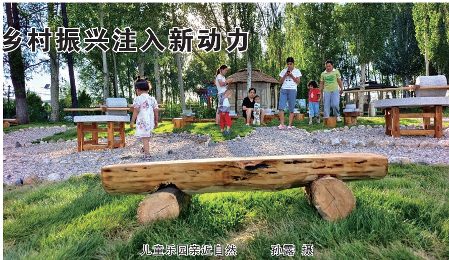
儿童乐园亲近自然