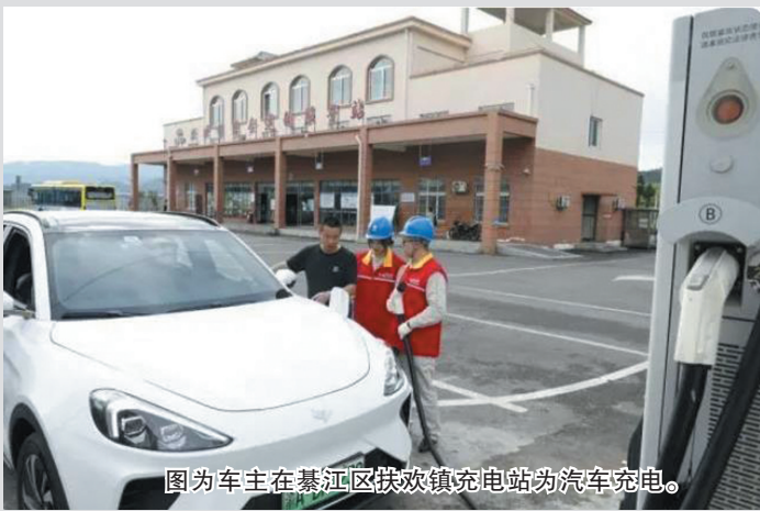
图为车主在綦江区扶欢镇充电站为汽车充电。

“新华视点”记者调查发现，在政策助推下，新能源汽车正加快进入农村市场。但一些地区仍存在充电桩设施不完备、车型适配度有待提升等问题，仍需加快建设充电设施、丰富下乡车型、完善支持政策，助力新能源汽车下乡。