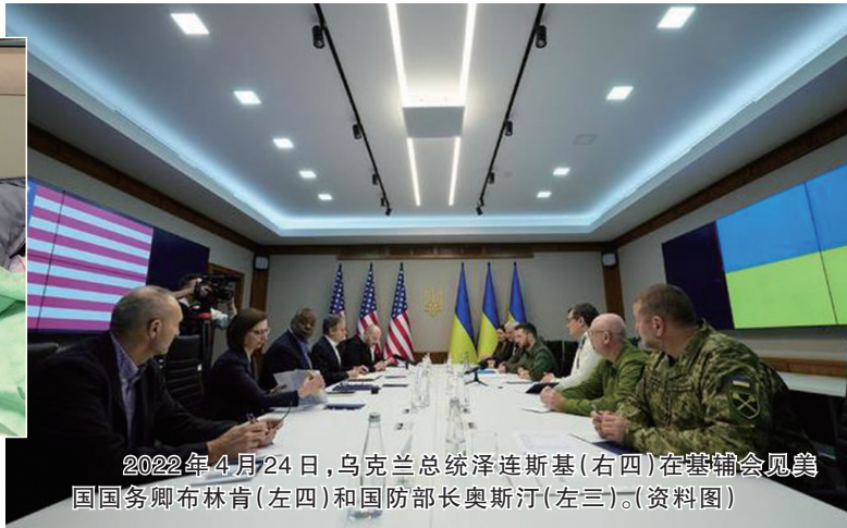
2022年4月24日，乌克兰总统泽连斯基(右四)在基辅会见美国国务卿布林肯(左四)和国防部长奥斯汀(左三)。(资料图)

美国国防部6日宣布新一批对乌克兰军事援助，价值1.75亿美元，包括用于美国援乌“艾布拉姆斯”M1A1型主战坦克的120毫米口径贫铀弹。