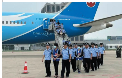
图为民警在郑州新郑国际机场押解犯罪嫌疑人下飞机。

天舟五号货运飞船在轨飞行期间，曾于2023年5月5日撤离空间站组合体，独立飞行33天后再次与空间站组合体进行交会对接，继续开展了相关空间技术试验。