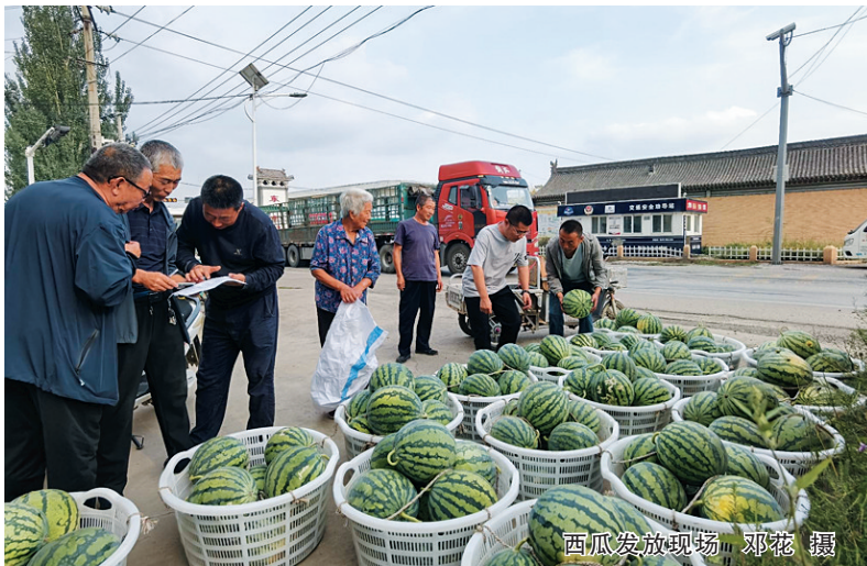
西瓜发放现场